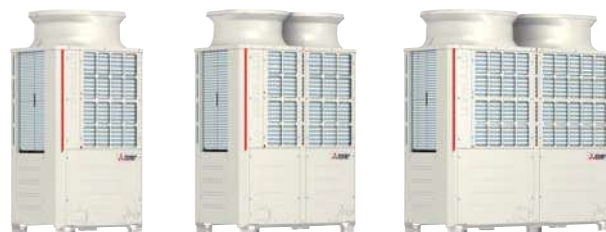
PURY-P200YNW-A PURY-P250YNW-A PURY-P300YNW-A