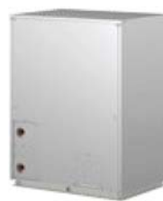
PQHY-P200YHM-A PQHY-P250YHM-A PQHY-P300YHM-A