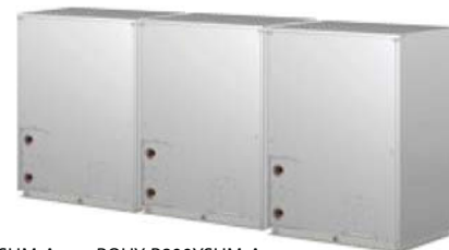
PQHY-P650YSHM-A PQHY-P800YSHM-A PQHY-P700YSHM-A PQHY-P850YSHM-A PQHY-P750YSHM-A PQHY-P900YSHM-A