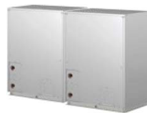
PQHY-P400YSHM-A PQHY-P450YSHM-A PQHY-P500YSHM-A PQHY-P550YSHM-A PQHY-P600YSHM-A