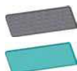
Фотокаталитический и антибактериальный фильтры