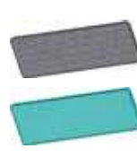
Фотокаталитический и антибактериальный фильтры