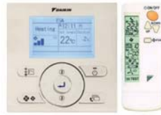
BRC1E52A BRC7F532F опционально