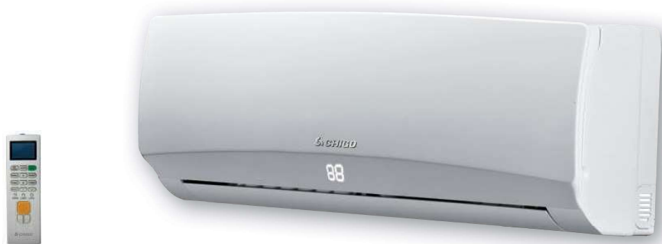
ZH/JA-03 (в комплекте с оборудованием)